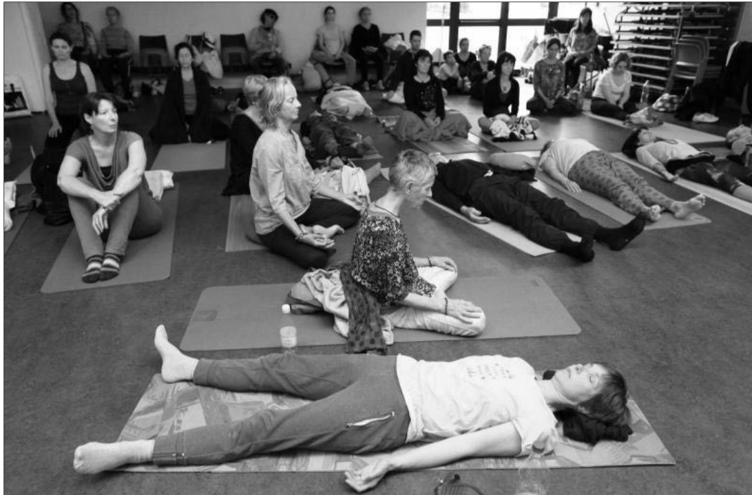
Près de 200 personnes ont profité des cours l'an dernier. Elles seront 100 de plus dès demain.

Comme l'an passé, le succès est au rendez-vous. Les inscriptions sont closes, mais Frédérique Buisson